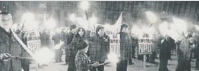
Fackelmarsch am Rande einer Deutschlandkundgebung

Mit dem Antritt der Regierung Brandt glaubten viele Rechtswähler irrtümlich, nun das „kleinere Übel“ CDU wählen zu müssen, um die Roten aus den Regierungssessel zu holen. Die NPD verlor rasch Wähler und bis 1972 auch ihre Landtagsmandate. Als keine Kontrolle durch NPD-Abgeordnete mehr möglich war, wurde 1972 der sogenannte Radikalenerlaß verabschiedet, der etliche Nationaldemokraten um ihre Beschäftigung im Öffentlichen Dienst brachte. Der Rechtsstaat BRD wurde immer mehr ausgehöhlt.