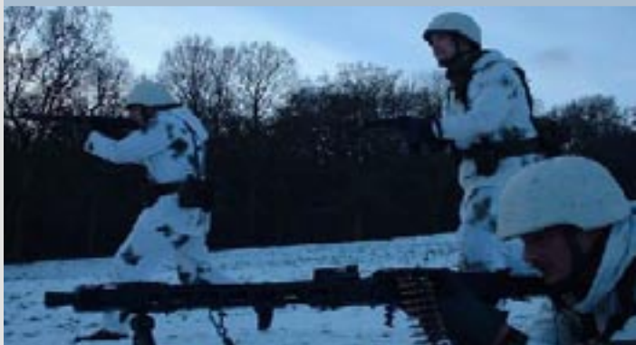
Heimatschutz statt Auslandseinsatz

Die NPD setzt sich für eine Reform des deutschen Rechtssystems nach streng rechtsstaatlichen Grundsätzen ein. Unsere Forderungen lauten: Schutz der Opfer von Gewaltverbrechen, tatsächliche Unabhängigkeit der Justiz, Eindämmung der Behördenwillkür, Stärkung der Polizei, Wiedereinführung der Todesstrafe bei wiederholtem Sexual-, Kindes-, Raub- und Massenmord und bei schwersten Fällen des Drogenhandels, Abschiebung krimineller Ausländer!