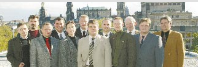
Die Fraktionsmannschaft der NPD in Sachsen