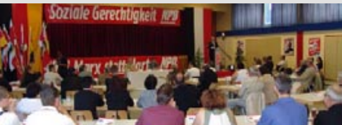
Demokratie in der NPD: Parteitag