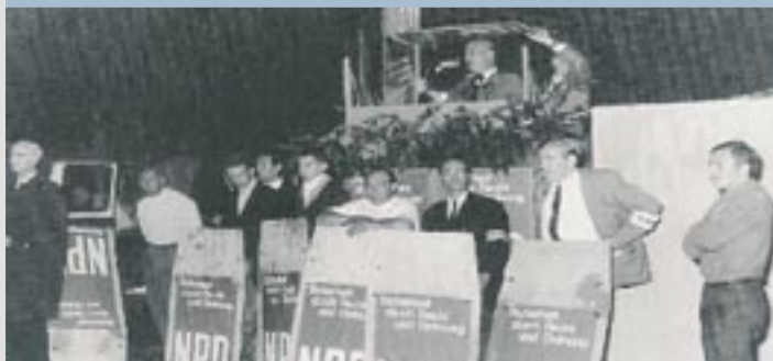
Deutschlandfahrt der NPD 1969