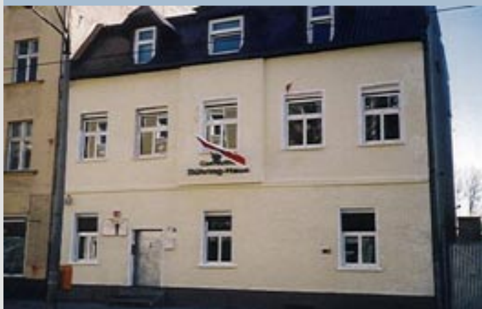
Die Parteizentrale in Berlin

Freunden und Mitgliedern sind ihre wirtschaftliche Grundlage. Ein aktives Mitglied wird also manches aus eigener Tasche bezahlen müssen.